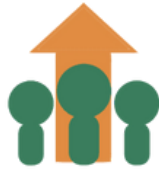
社内、職場の活性化、社員の定着率向上

企業は実習生受入を毎年出来ますので3年間で受入枠の3倍の実習生を招聘する事が可能となります。