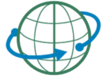
社内の国際化・海外展開

やる気溢れる実習生を受け入れることにより職場が明るくなり活性化されます。従業員も「技術を教える事」に誇りを持ち、自分の仕事にも良い影響を及ぼします。